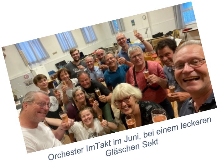
Orchester ImTakt im Juni, bei einem leckeren Gläschen Sekt