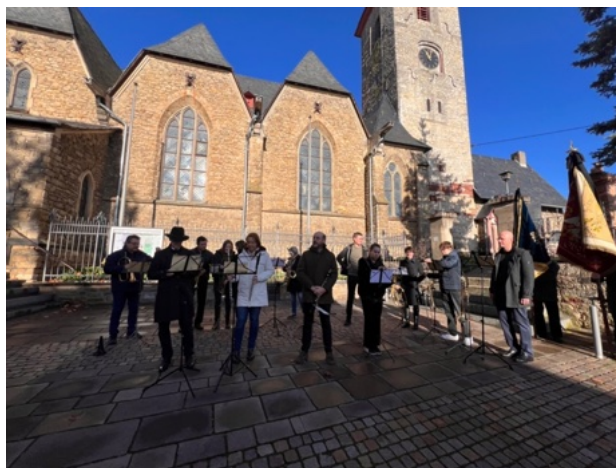
Das Orchester ImTakt, die Chöre und unser Fähnrich auf dem Martinsplatz am Volkstrauertag zur Mahnwache