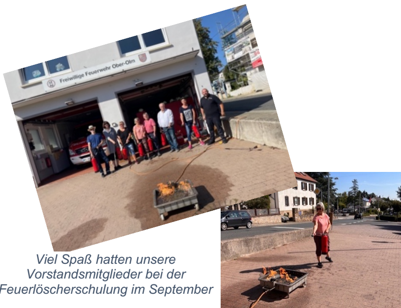
Viel Spaß hatten unsere Vorstandsmitglieder bei der Feuerlöscherschulung im September