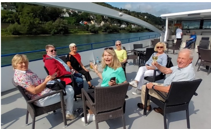
Der gemischte Chor Cäcilia macht im Sommer einen Ausflug mit dem Schiff auf dem Rhein