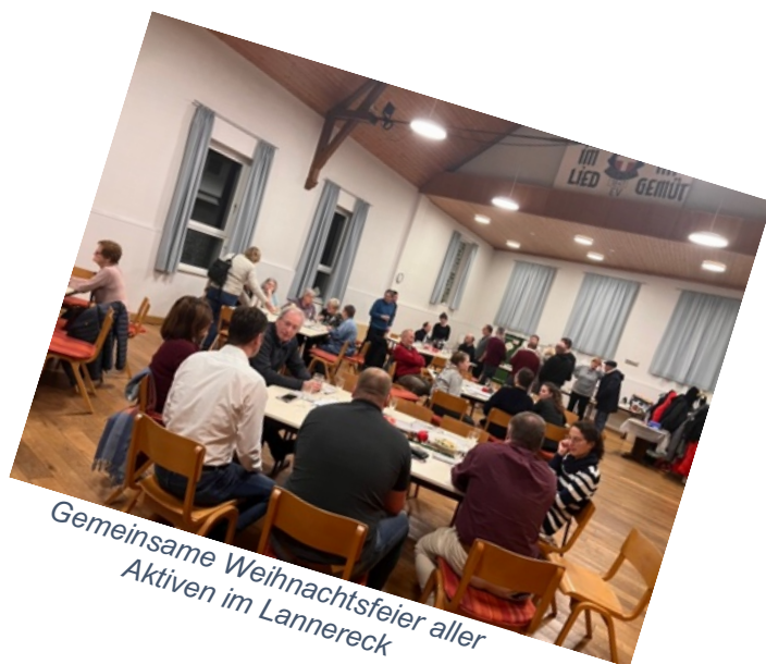
Gemeinsame Weihnachtsfeier aller Aktiven im Lannereck